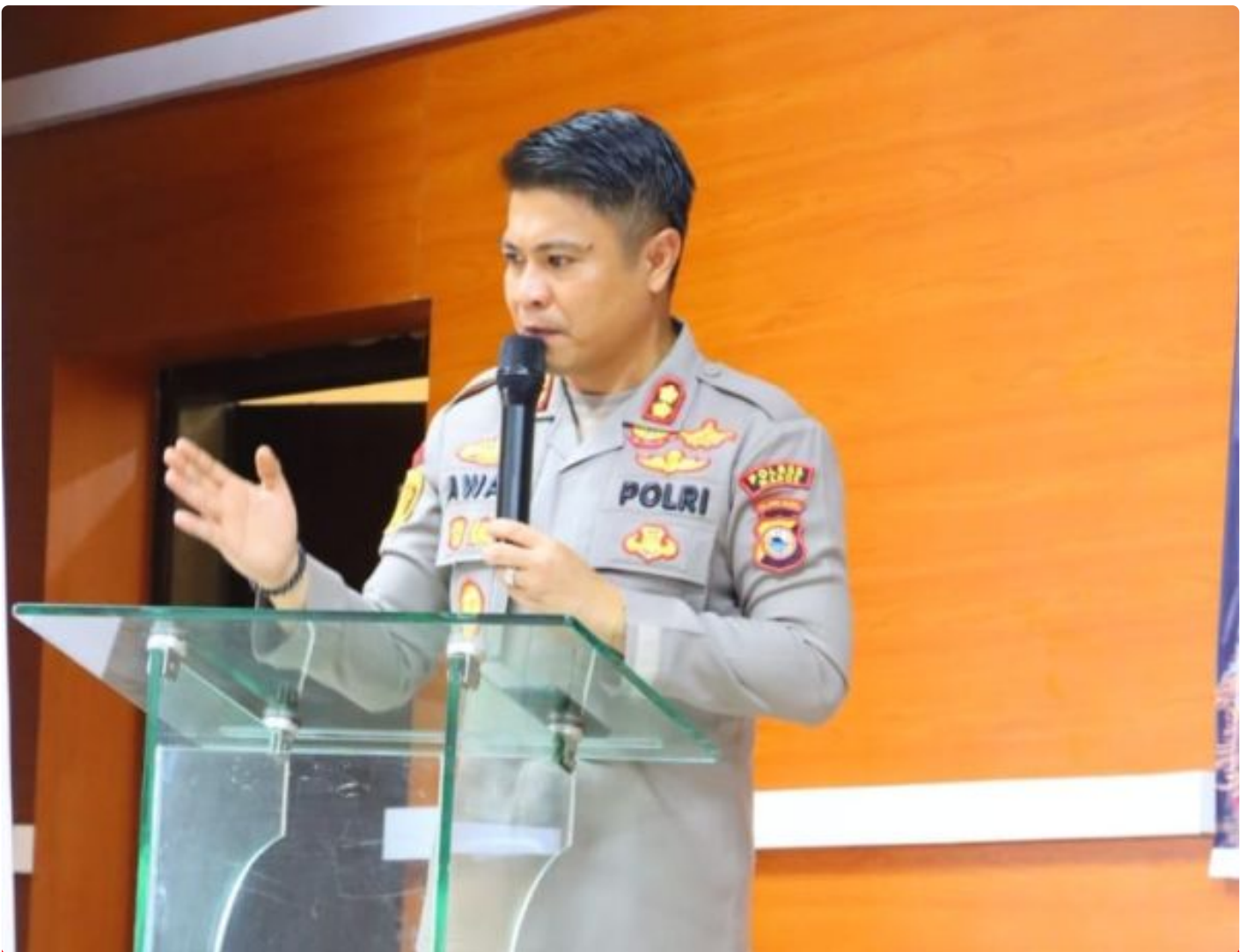
Bhayangkara - Humas Polres Maros

Maros - Polres Maros telah mengambil langkah tegas untuk menangani insiden tawuran yang terekam dalam video dan viral di media sosial.