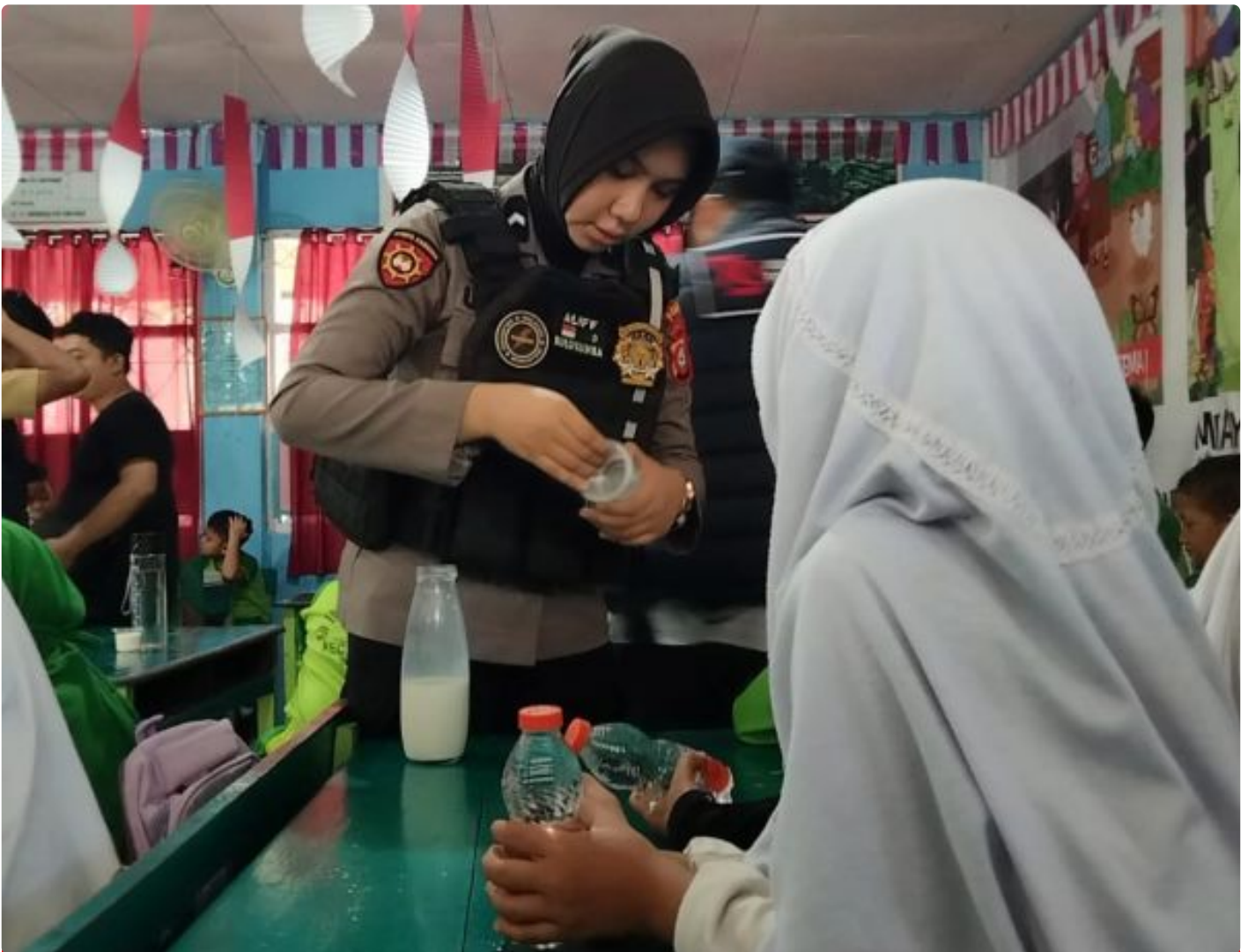
Bhayangkara - Humas Polres Maros