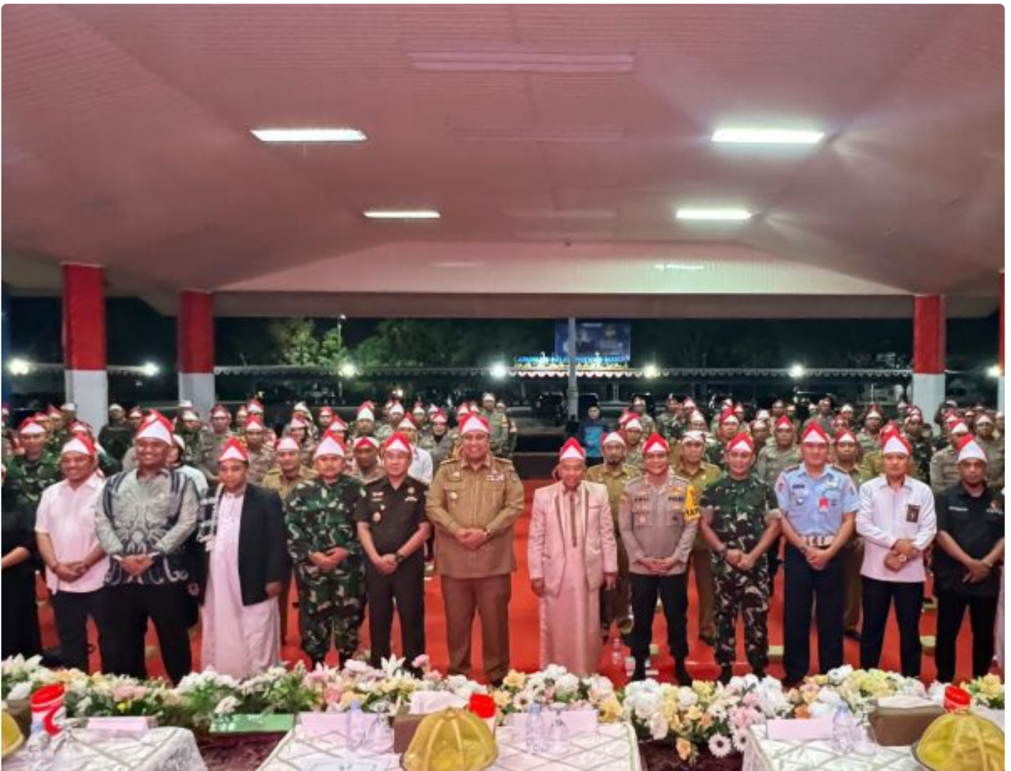
Bhayangkara - Humas Polres Maros

Maros - Kabupaten Maros melaksanakan deklarasi pilkada damai yang melibatkan tiga pilar utama bersama Forum Komunikasi Pimpinan Daerah (Forkopimda) di Lapangan Pallantikang Maros.